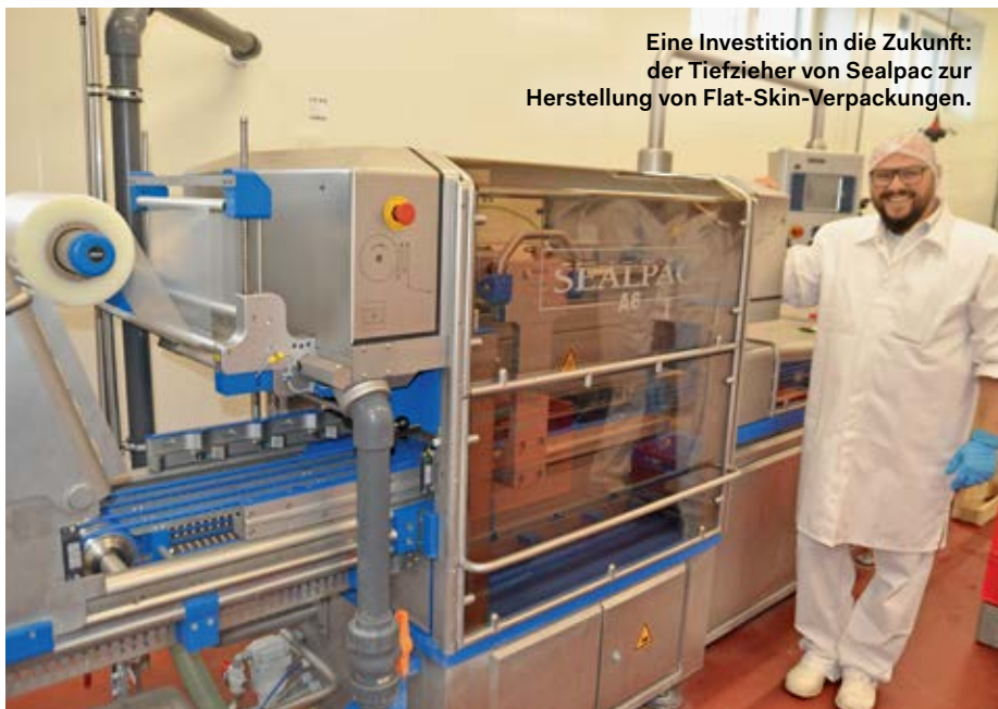
Eine Investition in die Zukunft: der Tiefzieher von Sealpac zur Herstellung von Flat-Skin-Verpackungen.

nierung des Altbestands. Und das natürlich unter den besonderen Anforderungen für den Umgang mit Wildbret.