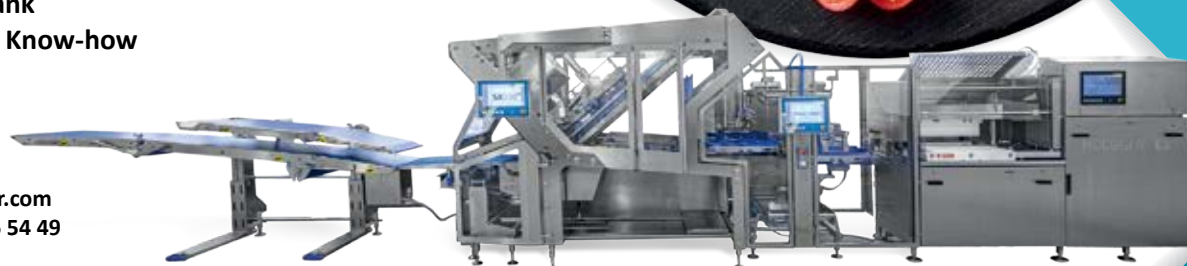
Vollautomatische Press to Slice Linie