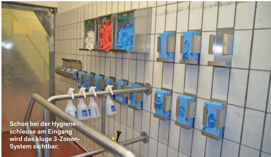
Schon bei der Hygieneschleuse am Eingang wird das Kluge 3-Zonen-System sichtbar.