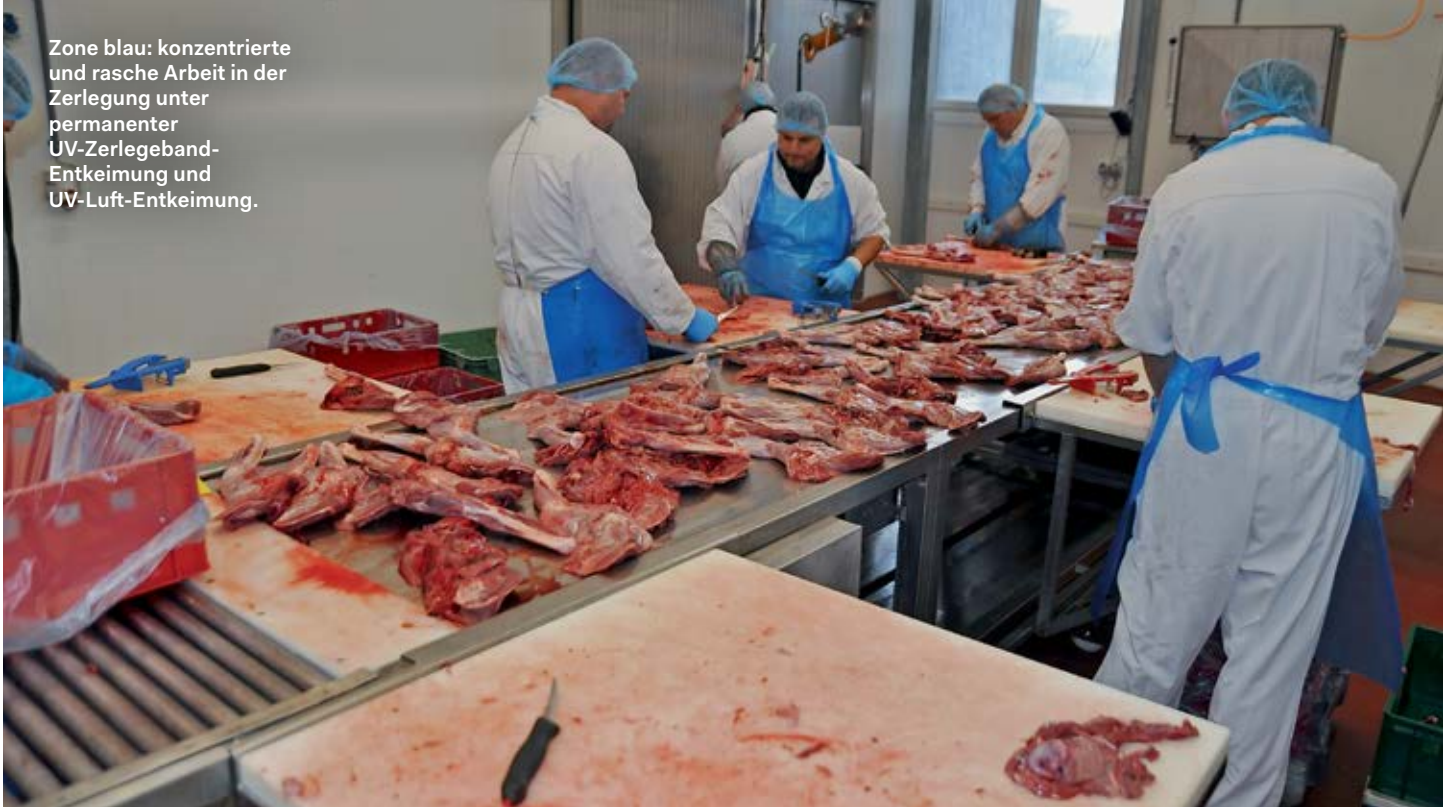
Zone blau: konzentrierte und rasche Arbeit in der Zerlegung unter permanenter UV-Zerlegeband-Entkeimung und UV-Luft-Entkeimung.