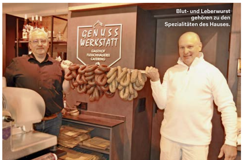
Blut- und Leberwurst gehören zu den Spezialitäten des Hauses.