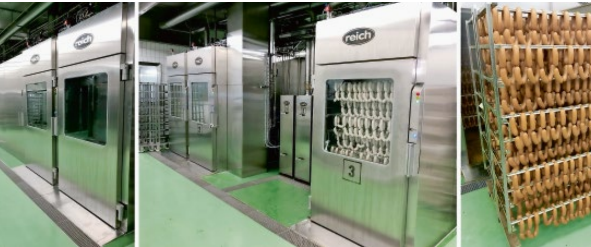
Penias Lebensmitteltechnik A 5261 Uttendorf, Gaismannslohen 15 T 07724/28 64 W www.penias.at

Ob Handwerksbetrieb oder Großproduktion: Optimales Räuchern, Kochen und Klimareifen sind das A & O für schmackhafte Produkte. Deswegen haben wir die nächsten Seiten „ Rauch- & Kochanlagen “ gewidmet. Lesen Sie hier über einige smarte Ideen und Lösungen für Ihr Unternehmen.