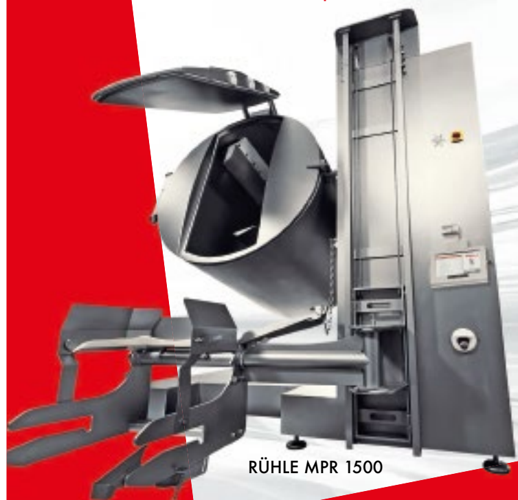
RÜHLE MPR 1500

Mit einem umfassenden Sortiment an innovativen Pökelmaschinen, Beratung und Service ist LASKA Ihr optimaler Partner für die Herstellung Ihrer Qualitätsprodukte.