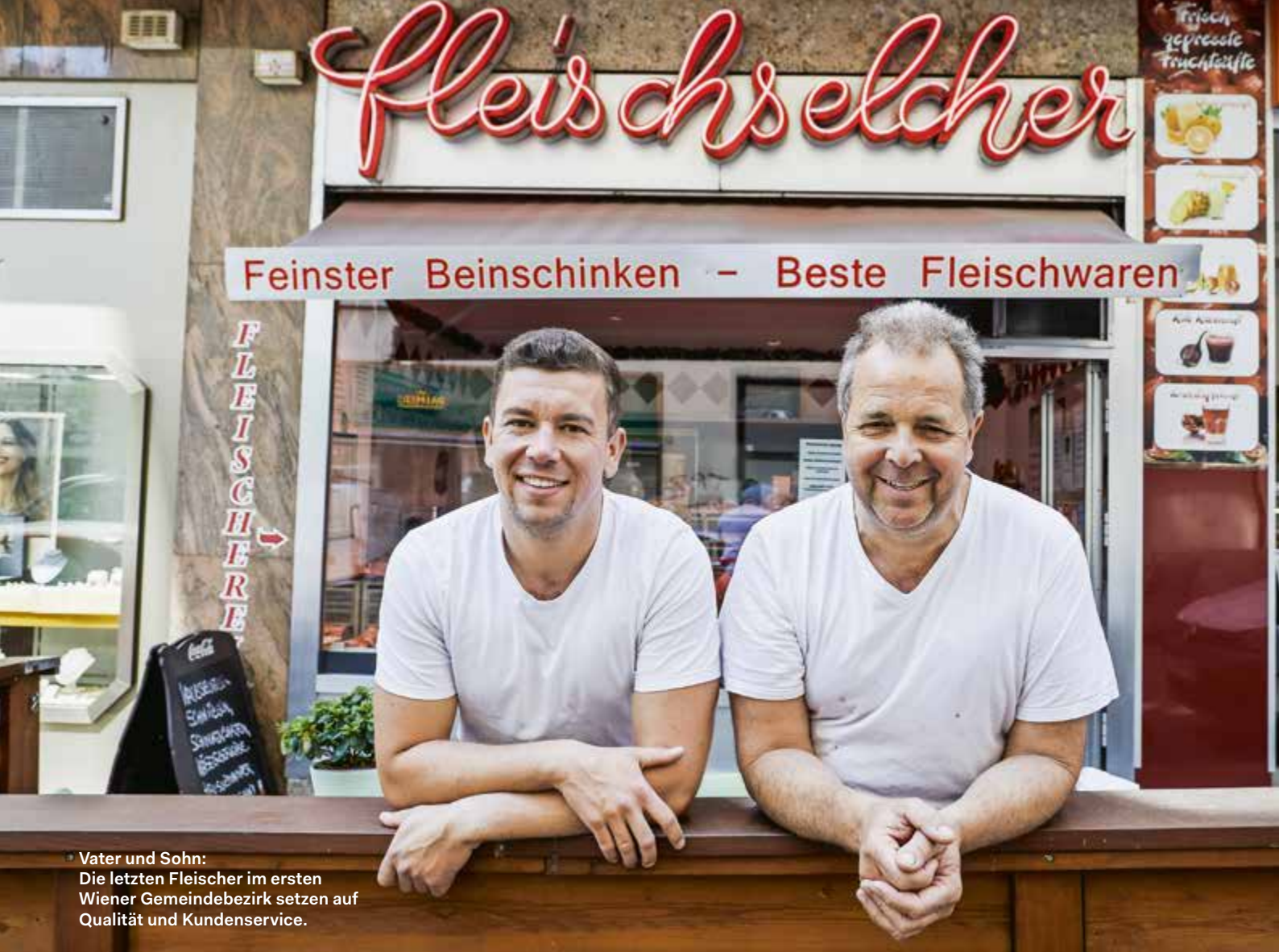
• Vater und Sohn: Die letzten Fleischer im ersten Wiener Gemeindebezirk setzen auf Qualität und Kundenservice.