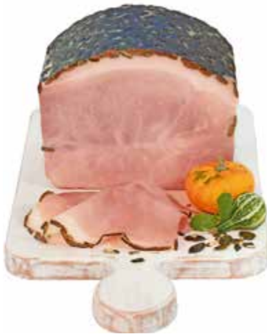
Der Kürbiskernschinken – mit knackigen Kürbiskernen verfeinert und streng limitiert erhältlich