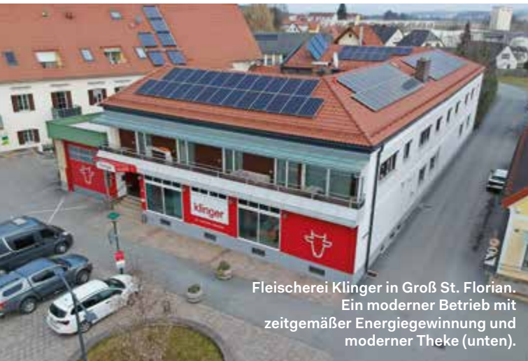
Fleischerei Klingler in Groß St. Florian. Ein moderner Betrieb mit zeitgemäßer Energiegewinnung und moderner Theke (unten).