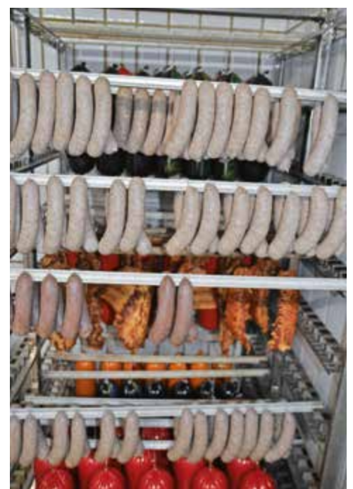
Ein Blick in den Kühlraum: Breinwürste warten auf die Kunden.