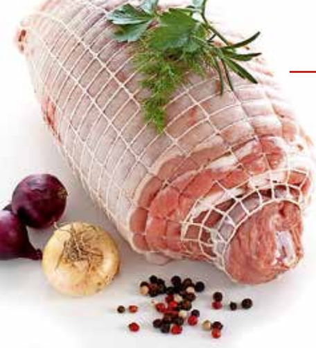
Die Fleischtheke im Sparmarkt. Auch Qualitätsfleisch von „Autners Schmankerlmanufaktur“ gibt's im Sparmarkt Kofler.

Sparmarkt in Telfes ideal, um ihn darüber hinaus bekannt zu machen. Unterstützt von ihrem Bruder begann sie, Angebote samt Fotos auf Facebook zu veröffentlichen. „Damit haben wir nicht nur Menschen erreicht, die neu nach Telfes gezogen sind. Auch viele Telfer waren bis dahin noch nie in unserem Geschäft“, sagt sie.