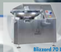
Blizzard 70 L