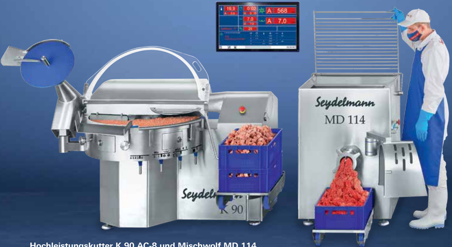
Hochleistungskutter K 90 AC-8 und Mischwolf MD 114

Seydelmann Hochleistungskutter und Hochleistungswölfe