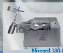
Blizzard 130 L