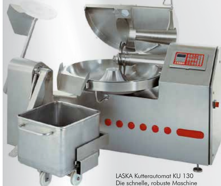
LASKA Kutterautomat KU 130 Die schnelle, robuste Maschine für den Dauereinsatz.

Die neuen Industrieautomaten setzen durch ihre Konstruktion, Ausführung und Arbeitsweise neue Maßstäbe im modernen Maschinenbau.