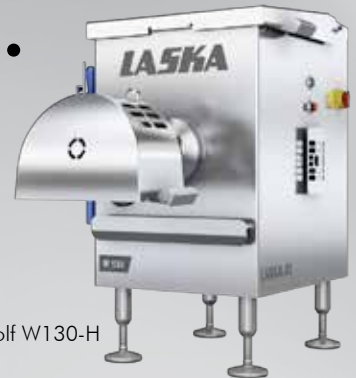
LASKA Wolf W130-H