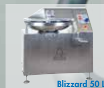
Blizzard 50 L