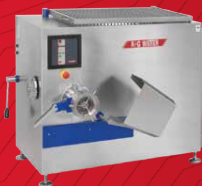
K+G WETTER WINKELWOLF E 130 Wolven in Perfektion.