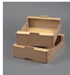
Wellpappe wird vielen Anforderungen gerecht.

Die Funktion einer Verpackung geht über den eigentlichen Zweck das Produkt zu schützen hinaus. Sie ist auch die Visitenkarte eines Unternehmens. Erst die Verpackung verleiht einem Produkt eine unverwechselbare Identität. Dunapack produziert Wellpappe mit allen gängigen Wellpapperohpapieren. Wellpappe ist ein umweltfreundliches Naturprodukt und besteht