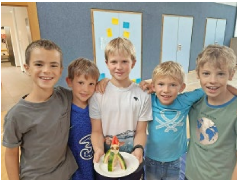
Hütts Ferienprogramm: Bereits zum vierten Mal veranstaltete das Unternehmen „Ferien im Betrieb“ im firmeneigenen Turnsaal.

Neben einem attraktiven Arbeitsplatz stehen den Mitarbeitern ein firmeninternes Fitness- & Sportprogramm sowie ein Masseur & Physiotherapeut zur Verfügung. Zudem werden regelmäßig Ausflüge und Aktivitäten veranstaltet, um den Teamgeist zu stärken. Neben Rabatten in den Shops können die Mitarbeiter in der Betriebskantine kostengünstig – Lehrlinge sogar kostenlos – frühstücken und auch zu Mittag essen. ■