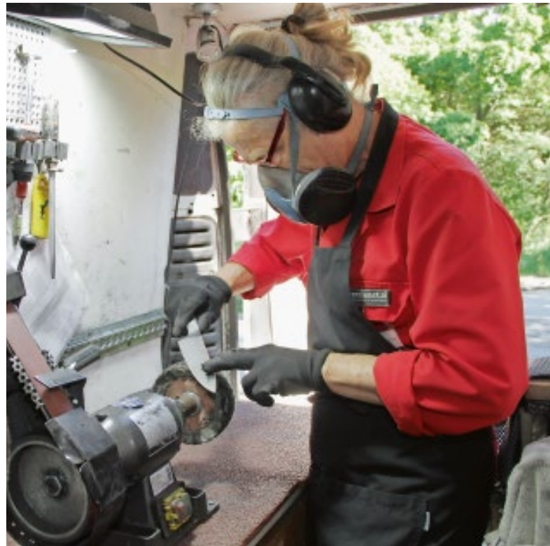
In seiner rollenden Werkstatt ist der 55-jährige Messermeister in seinem Element: „Man kann fast jedes Messer schärfen –, aber auch Scheren, Scheiben von Aufschnittmaschinen und vieles mehr!“

Mit diesem Wetzstahl soll man, geht es nach dem Meister, vor jeder Schneiderei über die Klinge ziehen. Das lässt sich leicht erlernen, zwei Methoden sind üblich: Raffalt: „Entweder stellen Sie den Stahl senkrecht