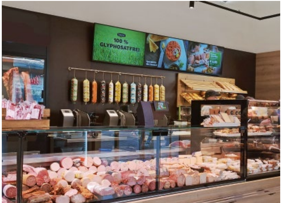
Bildschirmbespielungen sorgen für Unterhaltung beim Einkaufen und informieren Kunden über Neuigkeiten wie aktuelle Aktionen.

„Natürlich tun sich ‚die Jungen‘ leichter mit Social Media & Co, aber letztlich geht es