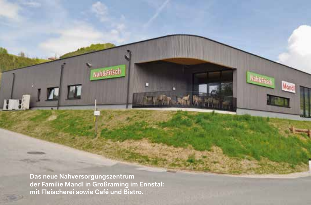
Das neue Nahversorgungszentrum der Familie Mandl in Großraming im Ennstal: mit Fleischerei sowie Café und Bistro.

Die Fleischerei Mandl aus Ternberg bei Steyr eröffnete in Großraming im Ennstal einen neuen Nah&Frisch-Markt mit Fleischerei sowie Café und Bistro.