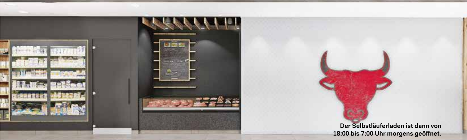
Der Selbstläuferladen ist dann von 18:00 bis 7:00 Uhr morgens geöffnet.