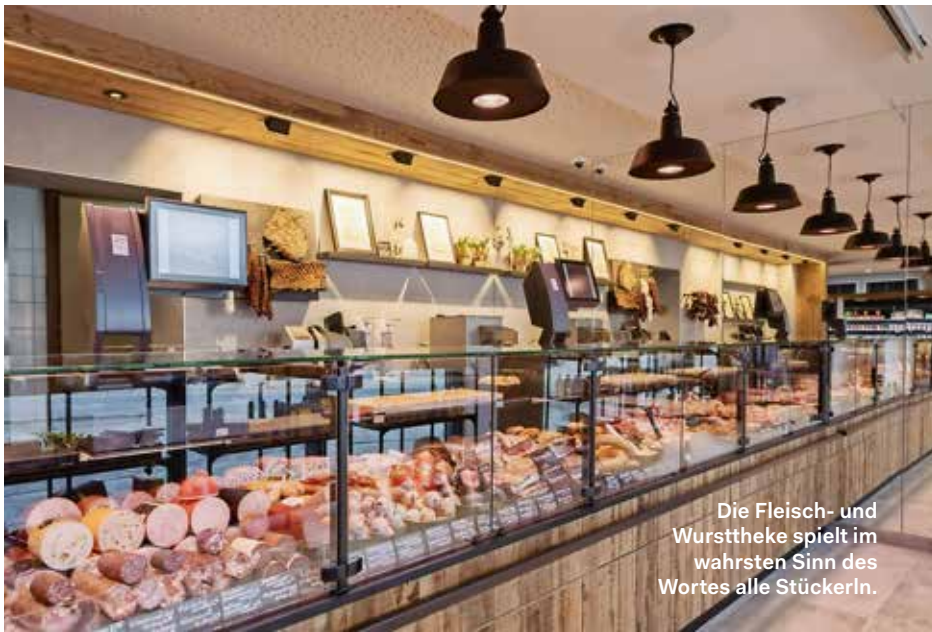
Die Fleisch- und Wursttheke spielt im wahrsten Sinn des Wortes alle Stückerln.