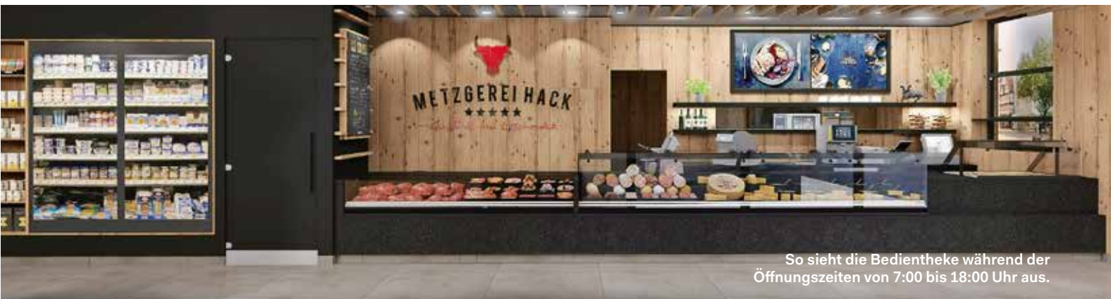
So sieht die Bedientheke während der Öffnungszeiten von 7:00 bis 18:00 Uhr aus.