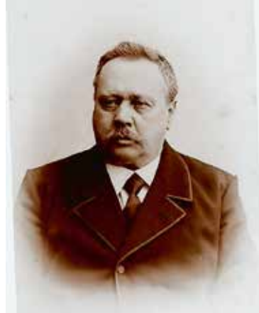
Der Unternehmensgründer: Christoph Albert Handtmann (1845–1918). Fotografie um 1900.