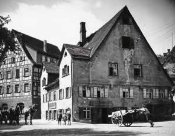
Die Keimzelle der Handtmann Unternehmensgruppe: die Bachmühle am Ehinger-Tor-Platz in Biberach an der Riß, seit 1873 Sitz der Mechanischen Werkstatt und Messinggießerei Handtmann; Fotografie um 1900.