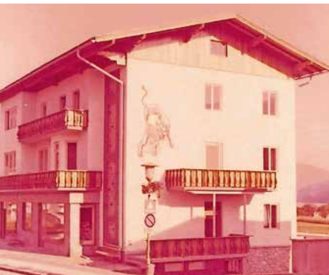
Die Fleischerei Heitzmann in den 70er-Jahren des vorigen Jahrhunderts.