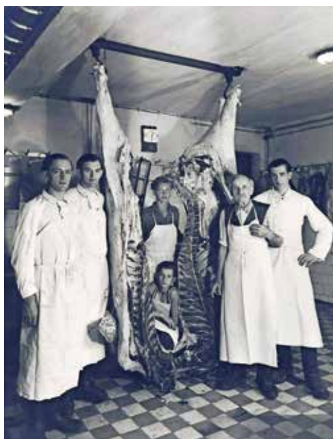
Reminiszenzen aus längst vergangenen Tagen in den Anfängen der Fleischerei Heitzmann.

Das klassische Brühwurstsortiment wie etwa Frankfurter, Braunschweiger, Weißwurst, Bratwurst oder Käsegriller darf im Hause Heitzmann ebenso wenig zu kurz kommen wie der Leberkäse in fünf Sorten (normal, Pizza, Pfefferoni, Käse und Zwiebel). Exzellente Fleisch- und Brätwürste wie die Extra- und Pikantwurst, aber auch Kochwurstspezialitäten wie Blut- und Leberwurst, Zwiebelstreichwurst oder Haussulz erfreuen den Feinschmecker.