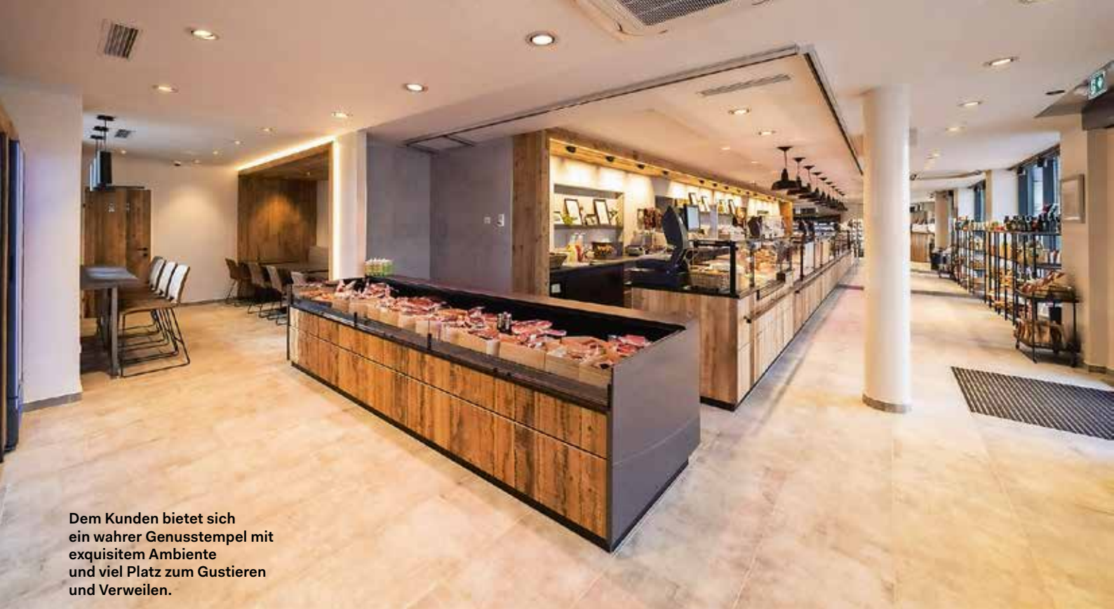
Dem Kunden bietet sich ein wahrer Genussstempel mit exquisitem Ambiente und viel Platz zum Gustieren und Verweilen.