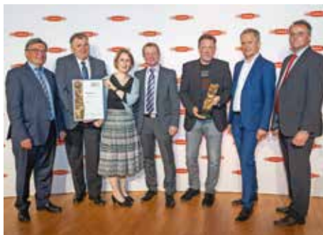
Auch das kräftig schmeckende, zarte Kalbinnenfleisch von Cult Beef durfte sich letztes Jahr über die AMA-Auszeichnung freuen.