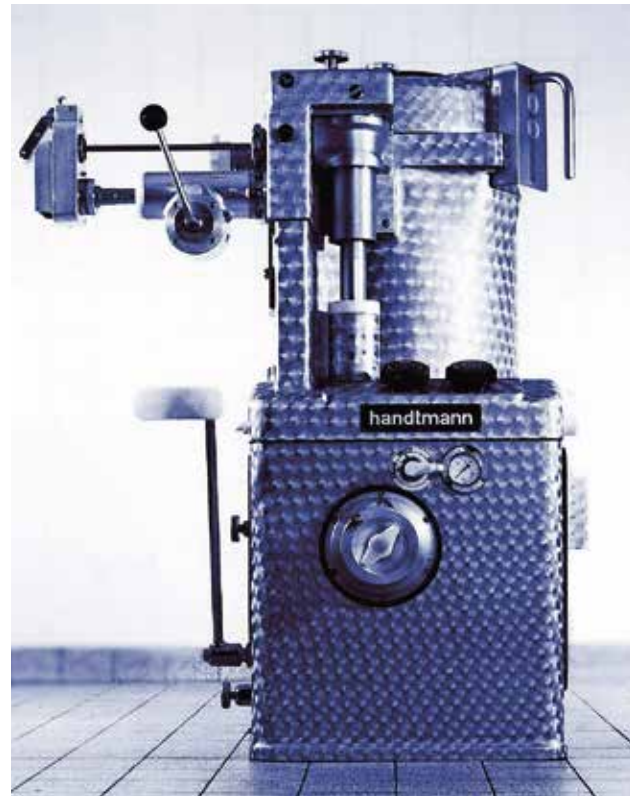
Verkaufsschlager: Die ab 1961 gebaute Handtmann Portioniermaschine FA 40-70 für die Wurstherstellung markiert den Durchbruch für die Handtmann Maschinenfabrik.

Auch das Produktportfolio wächst: 1967 bringt die Maschinenfabrik den ersten Vakuumfüller auf den Markt. Besonderheit ist das Flügelzellenförderwerk für exakte Portionie-