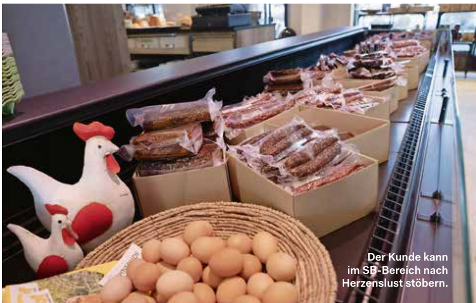
Der Kunde kann im SB-Bereich nach Herzenslust stöbern.

Klassiker wie das Verhackerte oder Grammschmalz dürfen keinesfalls fehlen.