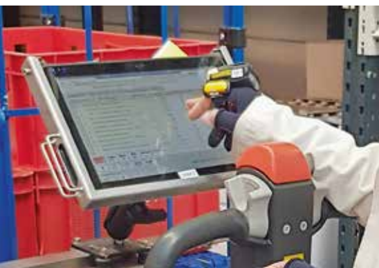
Mit dem Hands scanner werden Waren bei der Kommissionierung direkt erfasst und auf dem Touchpad notiert. Winweb-food ist modular aufgestellt, jeder Kunde erhält individuell, was er benötigt und kann aus fast 2.000 Masken wählen.

Was 1997 in der Fleischbranche begann, funktioniert heute auch in anderen Bereichen: Käseproduzenten, Fischfabrikanten, Hersteller alternativer Eiweißprodukte, Unternehmen für Heimtierbedarf und reine Handelsunternehmen setzen mittlerweile winweb-food ein – und das schon längst