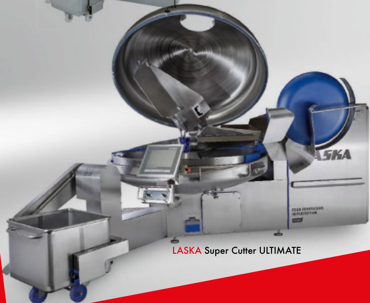
LASKA Super Cutter ULTIMATE