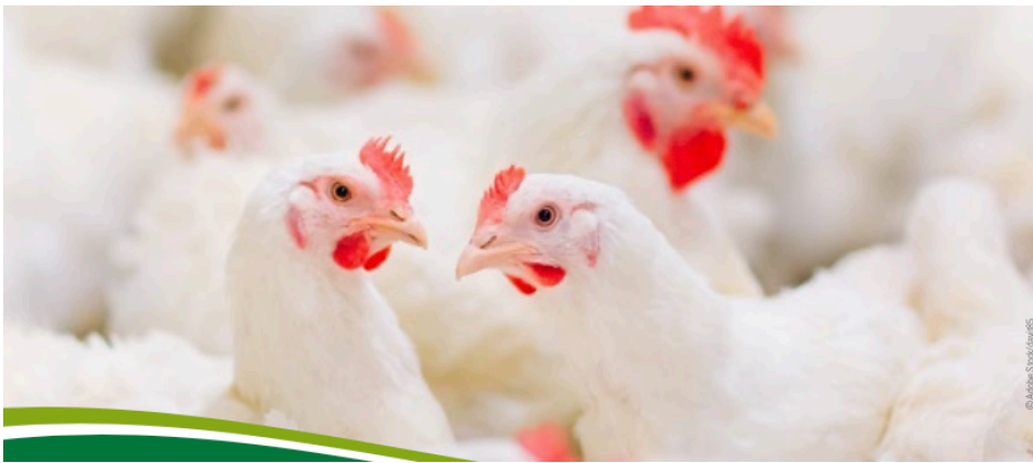
Alle Sparten der Geflügelmast im Detail beschrieben.

Das Ländliche Fortbildungsinstitut (LFI) hat einen detaillierten Ratgeber zur Mastgeflügelhaltung veröffentlicht. Von rechtlichen Grundlagen über Stallbau und Fütterung bis hin zur Vermarktung werden alle Aspekte der Haltung von Masthühnern, Truthühnern, Gänsen und Enten behandelt. Der Ratgeber bietet eine umfassende Informationsquelle für Geflügelhalter:innen und liefert praktische Tipps und Einblicke in die Geflügelindustrie.