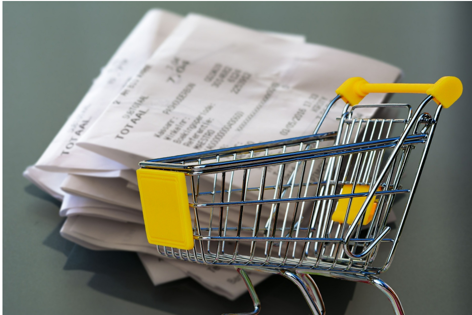
AK Preismonitor: Preisschock bei Wocheneinkauf hält an!

Kostendruck, Inflation und Krisen: So ist das Einkaufsverhalten 2022. Die RollAMA-Daten der ersten drei Quartale 2022.