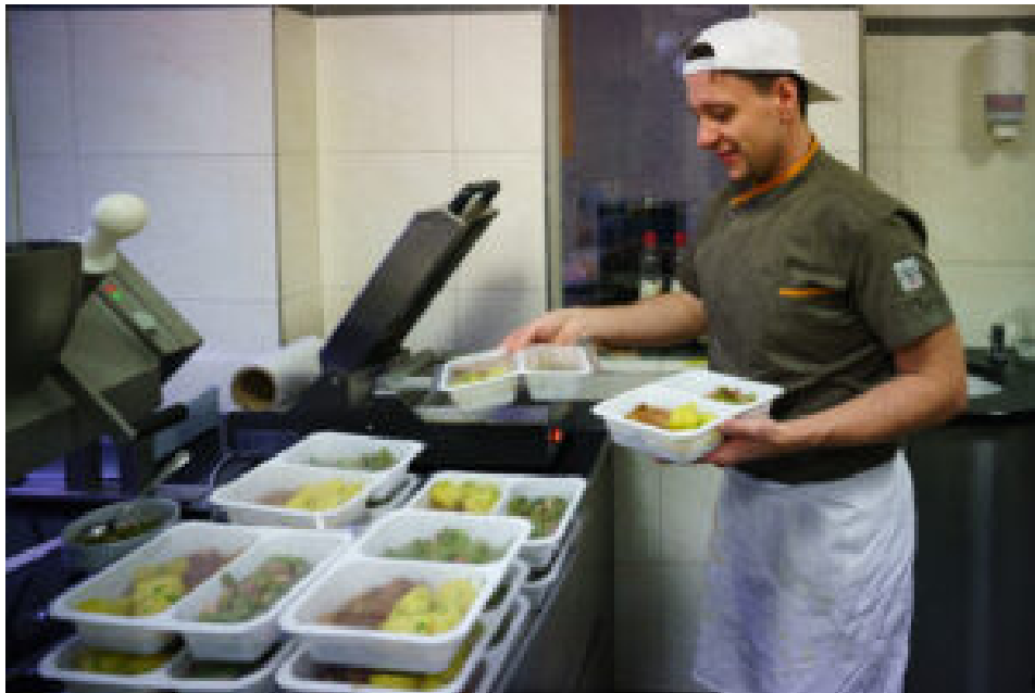
□□□□Im Geschäft in Fünfhaus wird immer ein Tagesteller angeboten.