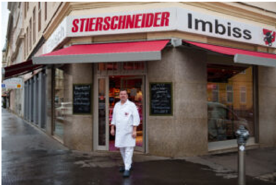
□□□ Die Fleischerei Stierschneider ist ein echter Wiener Traditionsbetrieb im 15. Wiener Gemeindebezirk, Märzstraße 9.