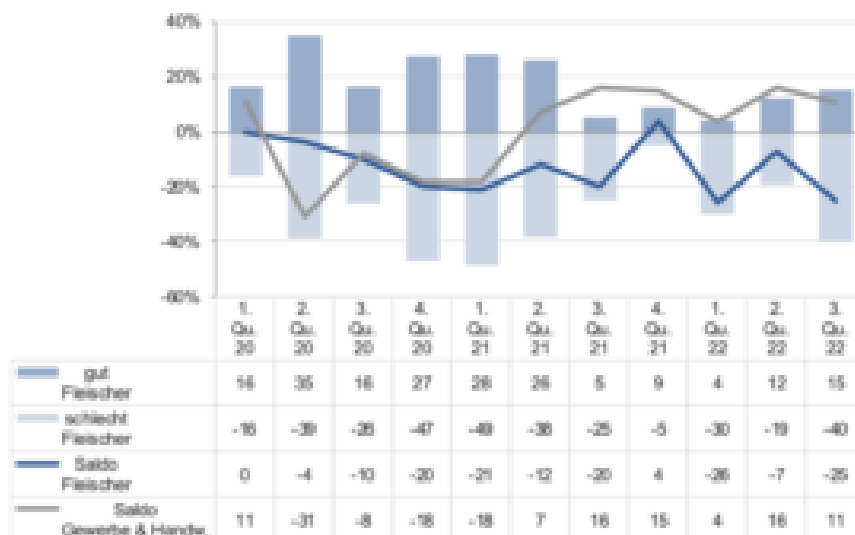
Grafik 2, Beurteilung der Geschäftslage