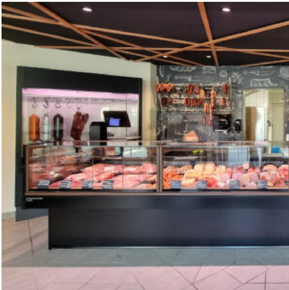
Die Fleischerei und Hofladen Zach in Mooskirchen hat den Verkaufsraum modernisiert.

Vrana Shopdesign versteht die Ansprüche dieser neuen Generation von Fleischereibetreibern und setzt ihre Visionen in die Realität um. Als Gesamtdienstleister für den Lebensmitteleinzelhandel bieten sie maßgeschneiderte Lösungen, die sowohl funktional als auch ästhetisch ansprechend sind. Besonders wichtig ist dabei die Integration des jeweiligen Standorts und die Berücksichtigung lokaler Besonderheiten.